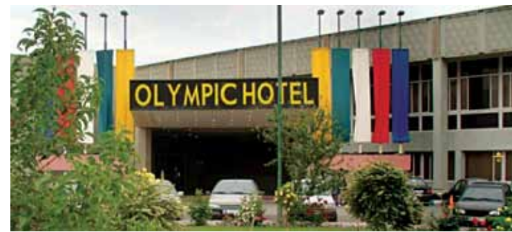
هتل المپیک • تهران

آدرس: ضلع غربی مجموعه ورزشی آزادی • بلوار دهکده • هتل المپیک